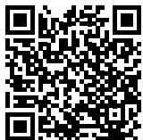
Frankfurt, Offenbach Dreieich